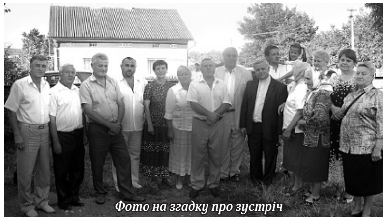
Фото на згадку про зустріч